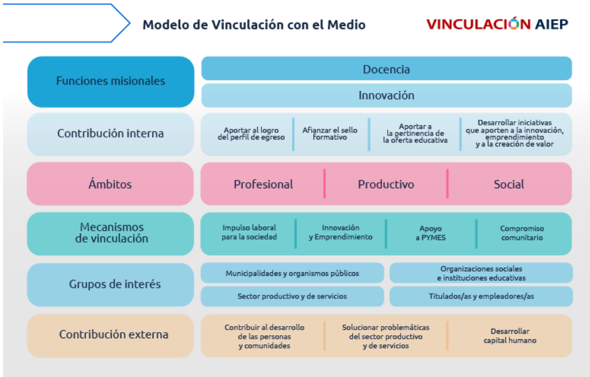
Figura 1: Modelo de vinculación con el medio de AIEP

c) Entorno significativo: En este campo debe describir el entorno significativo en que se desarrollará la iniciativa. Recuerde que el entorno significativo se relaciona con las comunas priorizadas de la sede para el despliegue de los mecanismos de vinculación con el medio (priorización 2024).